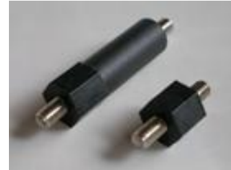
PSM3C (M3 P-0.5)

材質 = PPS 樹脂 (UL94V-0) 色 = 黒 使用温度 = -40~220℃ 金属ネジ = 黄銅 (ニッケルメッキ) 外周アヤメローレット